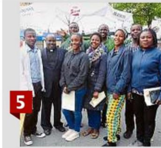
Besuch des Marktfests