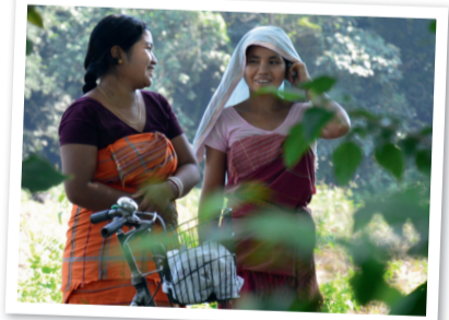
Natur und Umwelt auf der ganzen Welt schützen – auch in Indien.