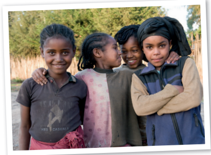
Kinderrechte überall achten – auch bei Kindern in Äthiopien.