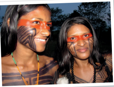
Alle Menschen sollen gut und sicher leben – auch die Ureinwohner/innen in Brasilien.